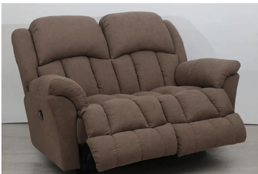
2 személyes motoros relax kanapé - Gilmore

A relax ülőgarnitúra 2 személyes kanapéja ülésein emelhető a lábtartó, dönthető a háttámla. A relax kanapé 2 személyes változatban kapható kézi működtetésű relax mechanizmussal, vagy motoros relax mechanizmussal. A motoros relax kanapé egyik előnye, hogy a közbenső lábtartó - háttámla döntési helyzeteket is fixen megtartja.