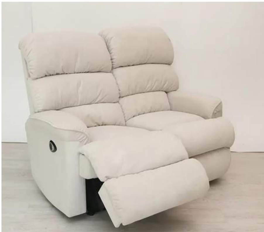
Preston 2 személyes relax kanapé

A legkisebb a Preston 2 személyes relax kanapé: 150 cm széles