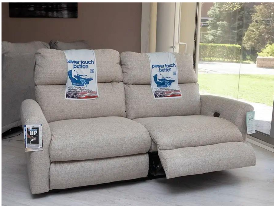
McPherson 2 személyes relax kanapé

A legszélesebb a McPherson 2 személyes relax kanapé: 192 cm